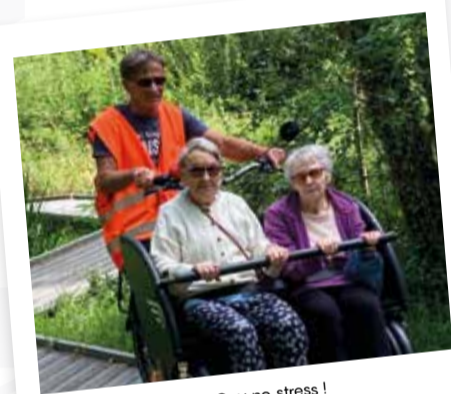
Avec Guy no stress !

Après 10 mois d'existence, l'antenne AVSA Scorvipontaine remercie l'ensemble des donateurs (institutions, entreprises, commerces et particuliers).