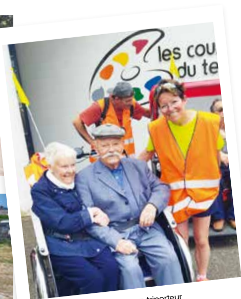
L'élégance en triporteur