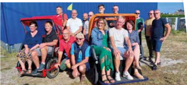
Une partie des bénévoles