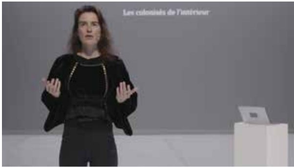
Autoportrait à ma grand-mère