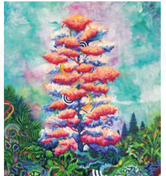
Mael Nozahic ©

Autant d'invitations à pénétrer un seuil, entre le réel et l'onirique, le noir et la couleur, l'ombre et la lumière. L'œil, le corps et l'âme voyagent dans cette atmosphère englobante,