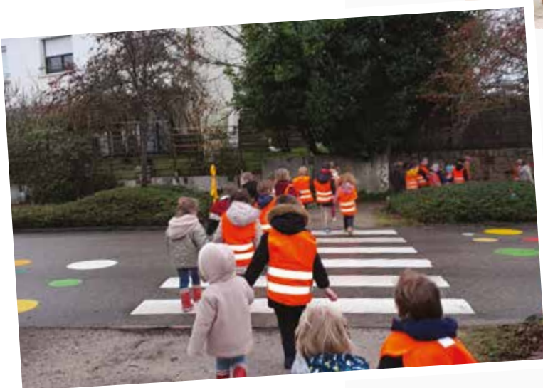
Signalétique au sol – Route de Lorient et rue Général de Gaulle.