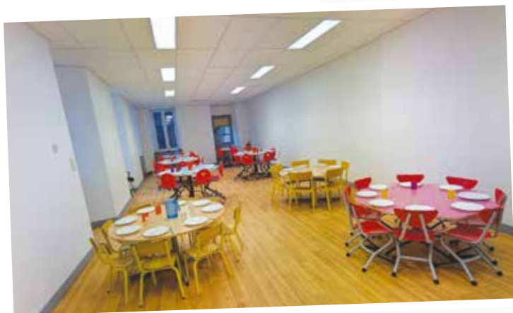
Aménagement de la salle bleue pour les élèves de l'école Pierre Thomas.

La fréquentation du restaurant scolaire ne cesse d'augmenter atteignant ces dernières années une moyenne de 400 enfants par jour.