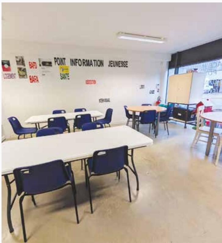
Aménagement d'un espace garderie à l'espace jeune.

neufs et performants. Il convient de rappeler que les repas sont confectionnés sur place à partir de produits issus de l'agriculture biologique (50 %), des circuits courts, ou bénéficiant de labels tels que Bleu-Blanc-Cœur ou Label Rouge.