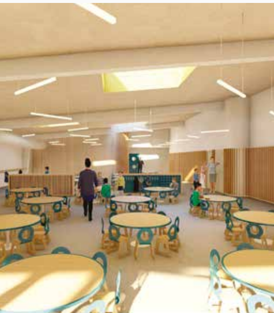
Future salle de restauration maternelle.