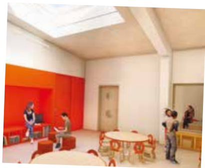
Projet - Espace garderie.