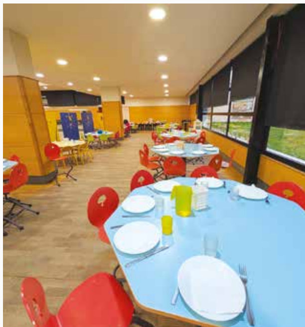
Aménagement de la salle polyvalente au complexe sportif pour les écoles Marc Chagall et St Aubin, avec un espace spécifique pour les maternelles de l'école St Aubin.

posent d'un confort visuel avec un apport d'éclairage naturel, d'un confort acoustique, d'un confort hygrothermique ainsi que d'un confort olfactif.