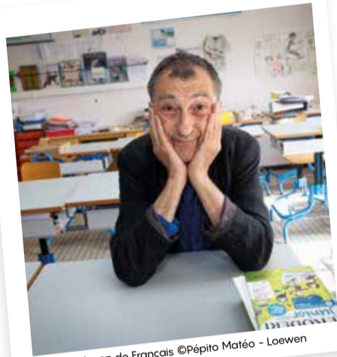
La leçon de Français ©Pépito Matéo - Loewen

Pépito Matéo n'est pas un professeur comme les autres. Dans La leçon de français, il nous invite à désapprendre les usages courants de la langue et à nous en autoriser de nouveaux.