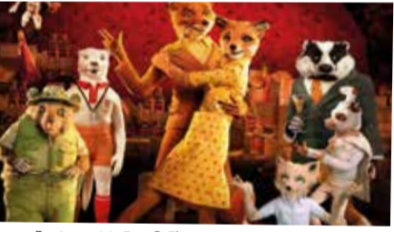
Fantastic Mr. Fox

FANTASTIC MR. FOX / WES ANDERSON Cinéma de Noël Lundi 19 décembre — 17h + Goûter de Noël dès 16h À partir de 8 ans