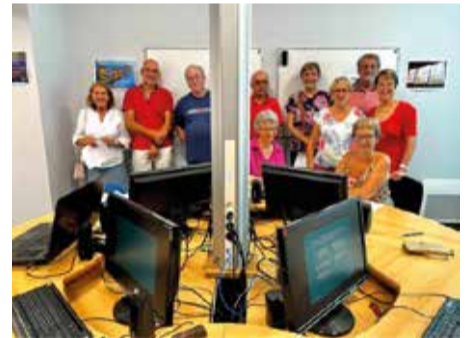
Quest-France le 30 Août 2022

Contact : Secrétariat des associations, route de Lorient Pont-Scorff - 02 97 32 50 27 Mail : aips-pontscorff@wanadoo.fr